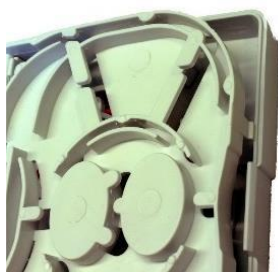
Gniazdo abonenckie serii CTB2-A /wyróżniony zatrzask blokujący/