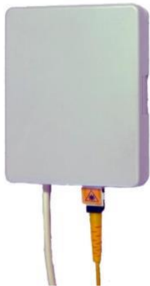
Gniazdo abonenckie serii CTB2-A

Gniazda abonenckie serii CTB2-A przeznaczone są jako zakończenie linii abonenckiej.