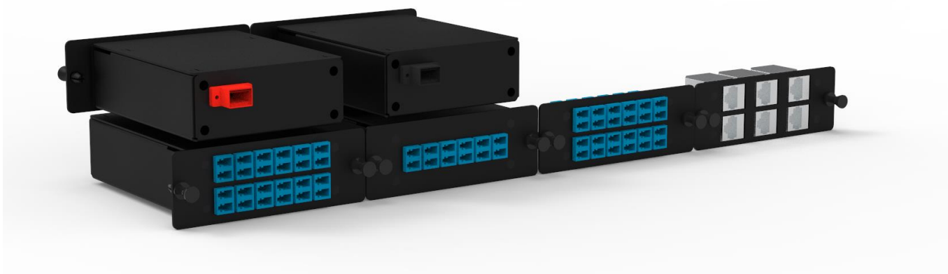
Wizualizacja modułów krosowych/przejściowych wyposażonych w adaptery

Moduły przełączeniowe instalowane w półkach HEL-HC-1U-4M, umożliwiające spawanie, przejście oraz krosowanie patchcordów światłowodowych lub miedzianych w wielu konfiguracjach.