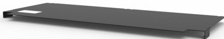
Wizualizacja osłony górnej