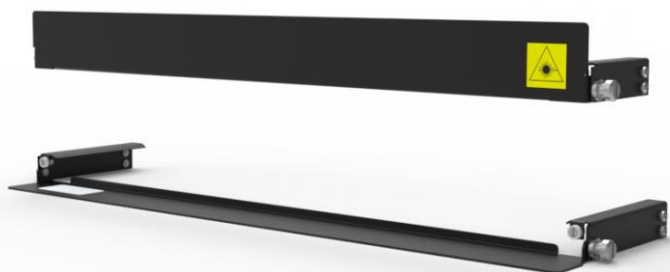
Wizualizacja osłon przednich