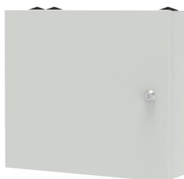
Przełącznica POC-BOX z sekcją zapasu kabla – zamknięta