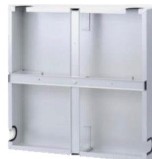
Stelaż zapasu kabla z pokrywą STZK-60-N – widok z tyłu