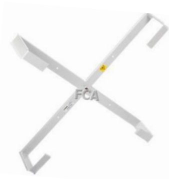
Stelaż naścienny serii STZK

Stelaże zapasu kabla umożliwiają bezpieczną organizację zapasu kabli z zachowaniem ich rekomendowanego promienia gięcia.