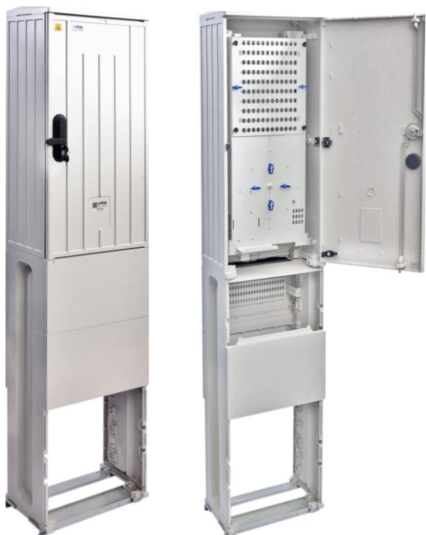
Szafka kablowa serii SUS-PH

Światłowodowa szafka kablowa przeznaczona do zastosowań FTTH.