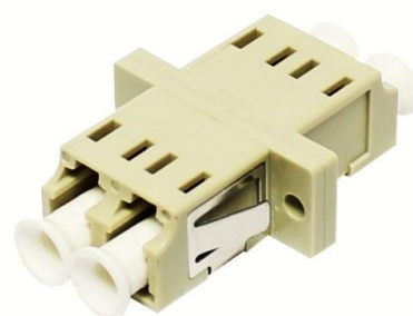
Adapter LC/PC duplex