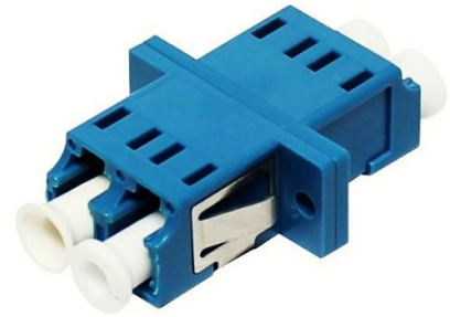
Adapter LC/PC duplex