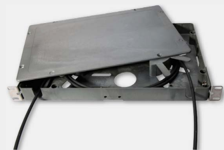
Skrzynka zapasu kabla FTTA-SZK