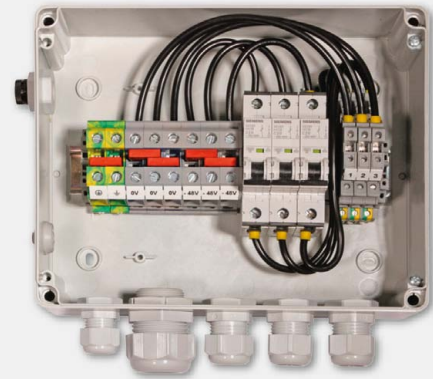
Skrzynka antenowa PTTA-SAH-3