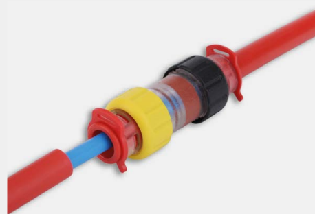
Złączki proste z doszczelnieniem gazowym mikrokabla FP-ZM-IK

Złączki proste mikrorurek z doszczelnieniem gazowym mikrokabla