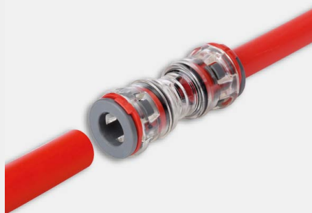
Złączka prosta FP-ZM-I10-8N-KB