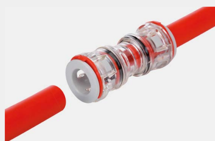
Złączka prosta FP-ZM-I12-8N-KB