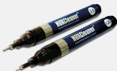
Długopisy czyszczące HuxCleaner 125 i 250