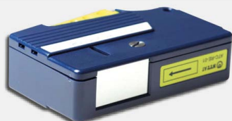
Narzędzie OptiPop R