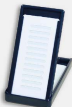
Karta czyszcząca Optipop C