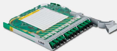
Kompaktowy moduł uchylny LiSA KMU z adapterami typu SC/APC