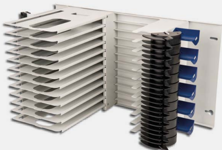
Półka modułów uchylnych LiSA NGR-PMU-19-6U