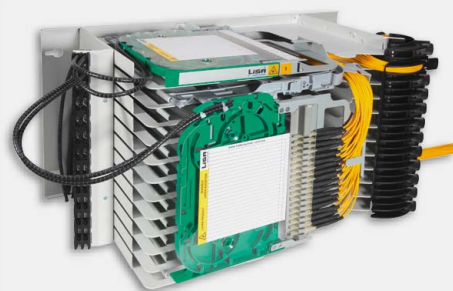
Kompaktowy moduł uchylny w półce LiSA NGR-PMU